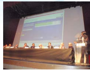
Présentation Dirig' Sports de Glace