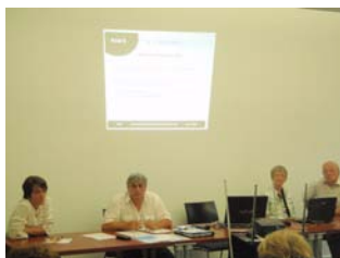
Réunion CSN Ballets