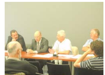
Réunion CSN Curling