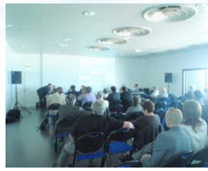
Réunion Vendredi 12 juin