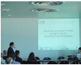
Réunion Vendredi 12 juin