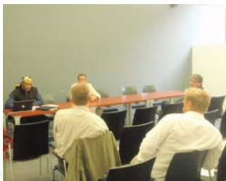
Réunion CSN BLS